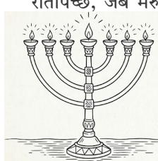
दीपदान - संसारको ज्योति

रातपिच्छे, जब मरुभूमि र छाउनी अन्धकारले ढाकिन्थ्यो, तब सातवटा दीप भएको सुनको विशाल दीपदानको न्यानो प्रकाश अँध्यारोलाई चिरेर चम्किन्थ्यो । ती स्थिर र उज्वल किरणहरूले बिहानसँगै फिक्का हुने ताराहरूलाई समेत ओझेल पार्थे ।