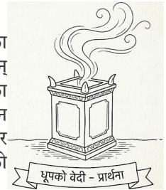
धूपको वेदी - प्रार्थना

इसाएलको पवित्र भेट हुने पालमा परमेश्वरका जनहरूको सेवाकार्यलाई झल्काउने दुई महान् प्रतीकहरू उभिएका थिए—जसले ख्रीष्टियन जीवनका दुई महत्वपूर्ण पक्षहरूलाई प्रकट गर्थे । दिनप्रतिदिन धूपको वेदीबाट मिठासपूर्ण सुगन्ध माथितिर उठिरहन्थ्यो, जसले स्वर्गतिर उक्लँदै जाने प्रार्थनाको सुगन्धलाई संकेत गर्थ्यो ।